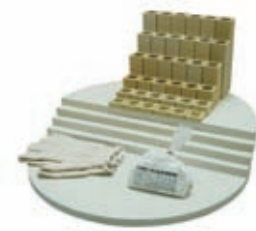
El equipo de muebles de un horno e23S.