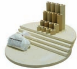
Se muestra el equipo de muebles de un horno LB18-3.

Equipo de muebles: El LB18-3 utiliza una plancha redonda llena de 15", cuatro planchas medias de 15", y cuatro de cada tipo de poste triangular (1/2", 1", 2", 4", 6" y 8") más 1 libra de la lechada "lavahornos" de cono 10 y un par de guantes resistentes a temperatura para descargar. (P/N: H-L-KITL/30). El LB18) la version con ladrillo de 2-1/2" es igual, pero las planchas son de 15-1/2" (P/N: H-L-KITL/00).