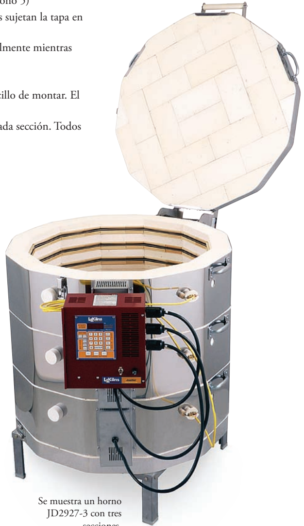
Se muestra un horno JD2927-3 con tres secciones.

Listado por UL: Listado por c-MET-us a los estándares de UL499.