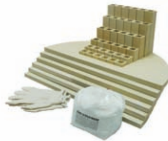
Equipo de muebles para un horno e28S-3.