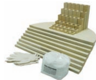
Equipo de muebles para un horno e28T-3.