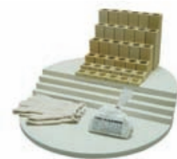
El equipo de muebles de un horno e23S.